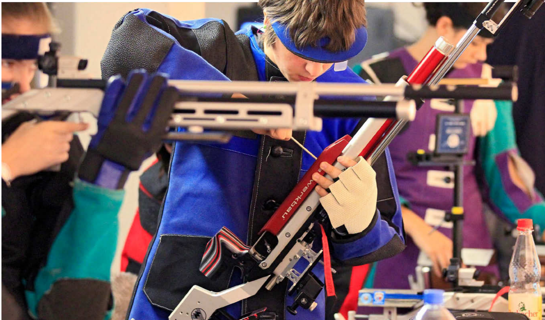
Volle Konzentration in der Vorbereitung auf das Finale: In Dettingen hat am Samstag der Nachwuchs des Schützengaus Main-Spessart die Pokalsieger ausgesprochen.

Geboren: am 22. Mai 1987 in Belgrad (Serbien) Größe/Gewicht: 1,88 m/ 88 kg Profi seit: 2003 Weltrangliste: 1. Turniersiege: 28 Größte Erfolge: Australian Open (2008 und 2011), Wimbledon (2011), US Open (2011), ATP-Weltmeister (2008), Davis Cup (2010) Top-Facts 2011: 10 Turniersiege, davon 3 Grand-Slam-Titel, 41 Siege in Folge zu Saisonbeginn (besten Saisonstart eines Profis seit John McEnroe 1984) Besonderes: Djokovic scheiterte in seinen ersten Profi-Jahren oft an seiner Gesundheit. Schwäche-Anfälle zwangen ihn mehrfach zu Aufgaben. 2010 wurde bei ihm eine Gluten-Allergie festgestellt. Gluten ist ein Bestandteil von Getreide und in vielen Lebensmitteln enthalten. Seit Ende 2010 verzichtet der Serbe deshalb unter anderem auf Pizza und Pasta.